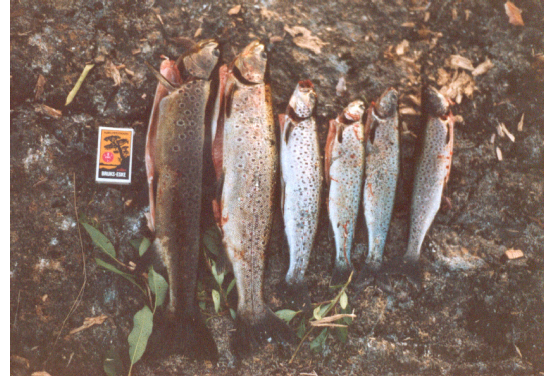
Fisk fra Finnvollvatnet

Fjellstyret har de siste åra mottatt positive tilbakemeldinger på fiske i allmenningen. Dette gjelder både kvalitet, kvantitet, informasjon og tilrettelegging.