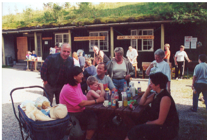
Skogdag på Langvasshelmen

Fjellstyret prioriterer fortsatt markedsføring av sine produkter og arbeidsoppgaver. Dette er en stor utfordring for fjellstyret. Hele tiden må fjellstyret sette seg inn i nye produkter og markedsføringsmetoder.