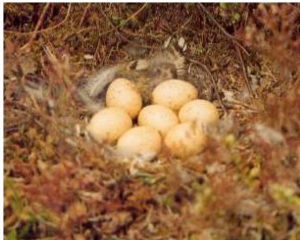
Røyereir i stien til Bjørnarvatnet

Skogsfuglebestanden synes å være stabil.