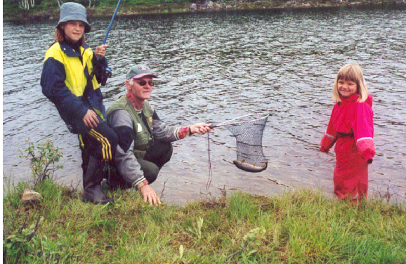
Fiske i Heggdølin