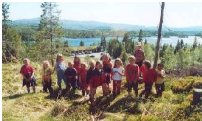
Barnehagen på tur

Skolene i Namdalseid og barnehagen har vederlagsfri leie av Langvassheimen (8 døgn i året). Dette i henhold til vedtak i fjellstyret. Skolene og barnehagen gis vederlagsfri leie p.g.a at vi finner det samfunnsmessig nødvendig at barn og unge skal lære seg å bruke fjellet på et tidlig tidspunkt. I fjellstyresammenheng er det en prioritert oppgave å stimulere og tilrettelegge for denne grupperingen slik at de får interesse av å bruke utmarka på en positiv og tilfredsstillende måte. Derfor har fjellstyret stilt både materiell, faglig bistand etc. når skoler har tatt kontakt.